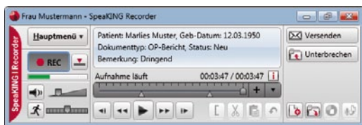
SpeaKING Recorder, das Herzstück des Systems

Der SpeaKING Recorder ist das Herzstück des Systems und bewältigt sowohl das digitale Diktieren als auch die Spracherkennung in einer kompakten Einheit. Der Benutzer kann jederzeit zwischen den verschiedenen Betriebsmodi wechseln, mit denen auch eine für die jeweilige Tätigkeit optimierte Ansicht verbunden ist. Die Spracherkennung entfaltet ihre volle Leistungsfähigkeit im Zusammenspiel mit den vielfältigen lieferbaren Fachwortschätzen. Welche Hardware Sie einsetzen, bleibt Ihnen überlassen: Ob kabellos, mobil oder stationär – SpeaKING Dictat unterstützt eine breite Palette von Diktiergeräten aller relevanten Hersteller.